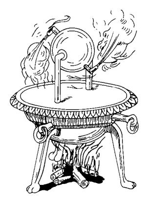
그림 1.1 헤로의 반작용 실험 기구

⑤ 1937년 영국의 Whittle이 순수한 반작용의 터보 제트기관 개발, 시험대에서 최초의 첫 시운전을 했으며 이것이 미국의 가스터빈 기관의 시초가 됐다.